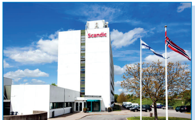
Scandic Hvidovre Kööpenhaminassa