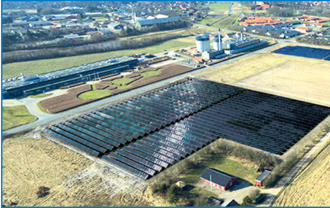
Aurinkokeräimiä kaukolämmön tuotannossa