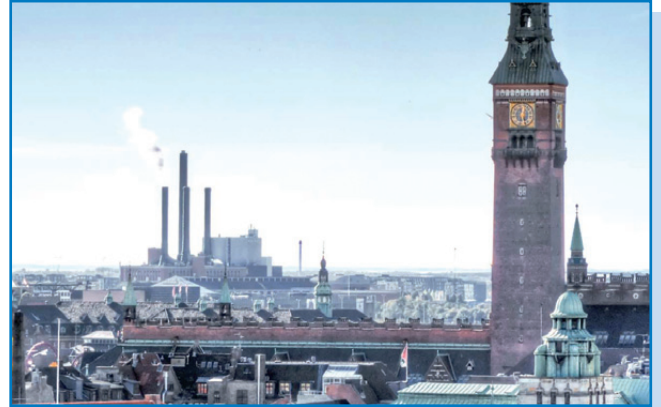
27.–28.4. kohteena on Kööpenhamina